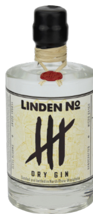
Linden No. 4 GIN