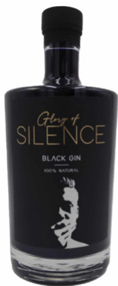
Glory of Silence