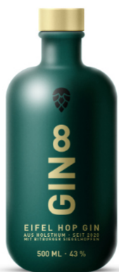
Eifel Hop GIN 8