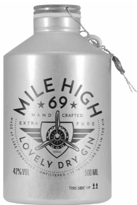
MILE HIGH 69 GIN