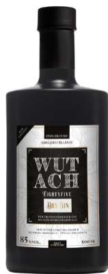
WUTACH 85% GIN