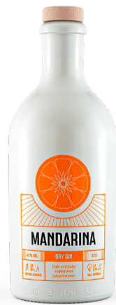
Mandarina Dry GIN