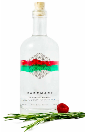
19 Circle Spirits